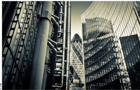
La City, cœur financier de Londres.

La Chambre de commerce française de Grande-Bretagne, une des plus grandes chambres françaises au monde avec 600 entreprises membres, dont 50 % non françaises, tisse des liens depuis 130 ans entre les sociétés des deux côtés de la Manche. Suite au programme de construction lancé par le gouvernement pour neuf fermes éoliennes géantes en mer du Nord, l'un des plus grands projets offshore du monde en haute mer, la Chambre de commerce française de Grande-Bretagne renouvelle sa mission de découverte Energies Renouvelables. En collaboration avec la mission économique UbiFrance de Londres, les 9 et 10 octobre 2013, elle proposera aux entreprises françaises de découvrir le marché éolien offshore britannique au travers de présentations d'experts et la possibilité d'échanger