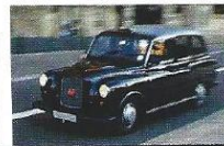
Les chauffeurs de taxi londoniens sont réputés être les meilleurs du monde.

■ recruitment-cfgeb.co.uk : la chambre de commerce française de Grande-Bretagne publie souvent des offres d'emploi. ■ jobs.theguardian.com : une autre adresse pour trouver un job. ■ jobcentrepplus.gov.uk : pour les formalités d'usage.